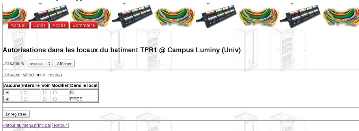
Figure 2 - Gestion des autorisations

On voit ici un exemple d'application de ces droits.